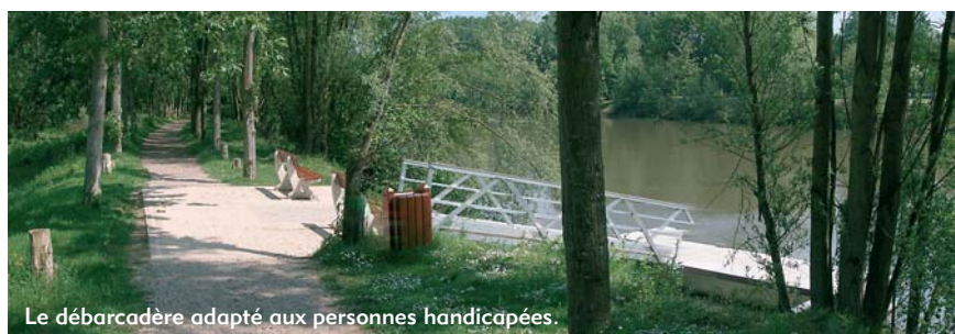
Le débarcadère adapté aux personnes handicapées.

Pontivy (14 000 habitants), située à la jonction du Blavet et du canal de Nantes à Brest, accueille depuis la saison 2004, grâce à la coopération de la Communauté de Communes de Pontivy et de la société de location Bretagne Plaisance, une halte nautique et une base de location. La concrétisation d'un projet qui tenait à cœur à Hélène Legendre, directrice commerciale de Bretagne Plaisance : « Depuis 1997, nous avions ce projet de créer une base de location à Pontivy car les plaisanciers qui louaient au départ de notre