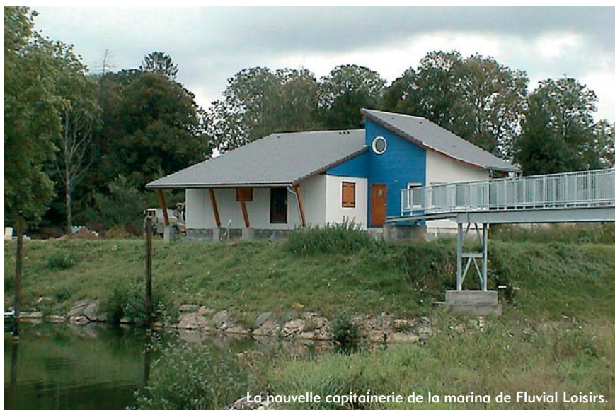
La nouvelle capitainerie de la marina de Fluvial Loisirs.