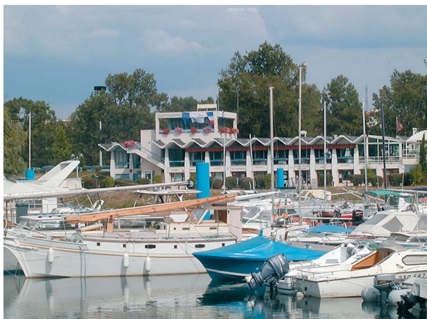
Le port de l'Epervière et sa nouvelle digue.

V. Pulchérie : « Nous voulons que le port de l'Epervière soit autre chose qu'un garage à bateaux. La nouvelle digue est