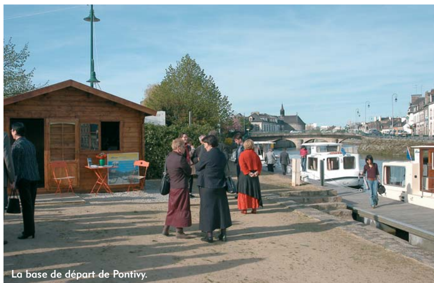
La base de départ de Pontivy.

base de Redon s'arrêtaient à Josselin pour éviter les 2 jours de navigation nécessaires au passage de l'échelle d'écluses [ndlr : 53 écluses entre Rohan et Pontivy] et il était très rare de voir un bateau à Pontivy. Mais en raison des nombreuses inondations, le projet n'aboutissait pas. » Entre 1995 et 2000 le Blavet a connu plusieurs crues dévastatrices et la remise en état des ouvrages d'art a demandé de gros travaux aujourd'hui terminés.