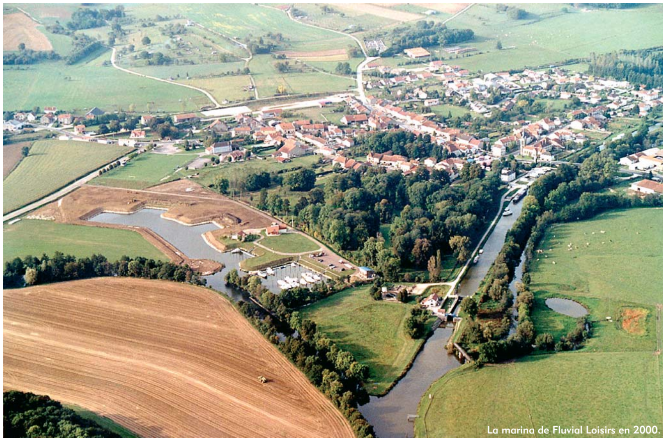
La marina de Fluvial Loisirs en 2000.

V. P. : « Nous visons l'excellence. Nous devons concilier la vie du port d'habitation et de la plaisance avec le pôle touristique et d'animation. Nous sommes certifiés ISO 9001 pour la qualité de nos prestations de services (capitainerie, sanitaires, restauration, avitaillement, grutage, zone technique, accastillage et réparation). [Ndlr : l'installation d'un système de récupération des eaux noires ou grises est en projet]. Nous attendons avec impatience l'obtention du label « Pavillon Bleu d'Europe » qui