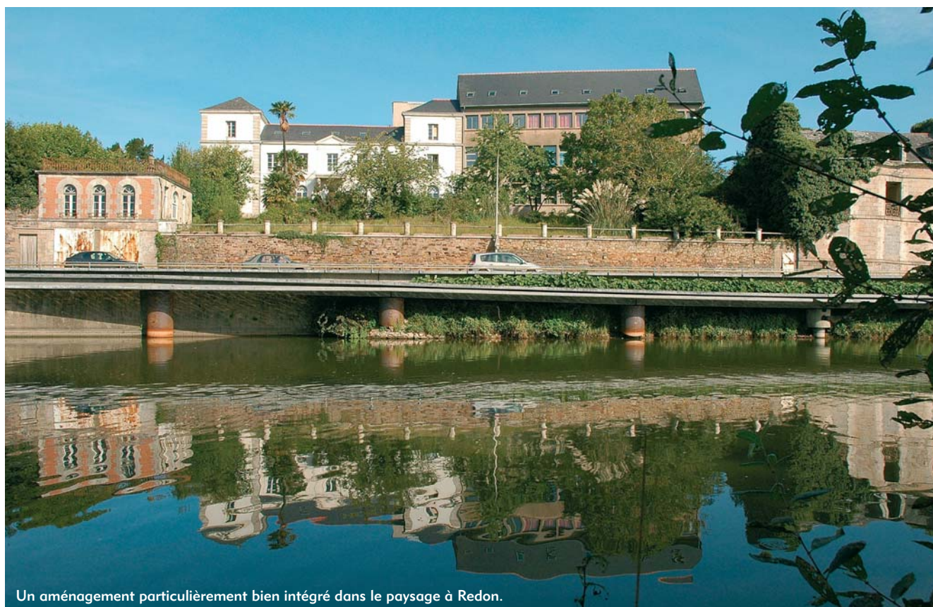
Un aménagement particulièrement bien intégré dans le paysage à Redon.

G. Lepotier : Nous n'avons pas effectué d'évaluation précise, mais les plaisanciers passent au moins une journée sur