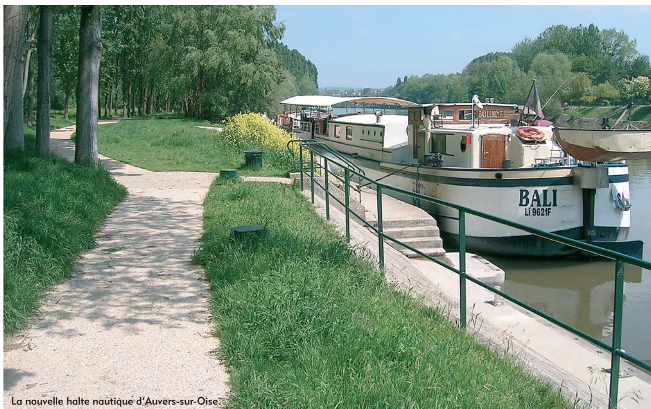
La nouvelle halte nautique d'Auvers-sur-Oise.

Le débarcadère et la halte d'Auvers-sur-Oise ont bénéficié d'une réhabilitation globale de la part de VNF permettant l'accueil de tous types de bateaux puisqu'ils sont équipés de francs bords variables facilitant également l'accès aux personnes à mobilité