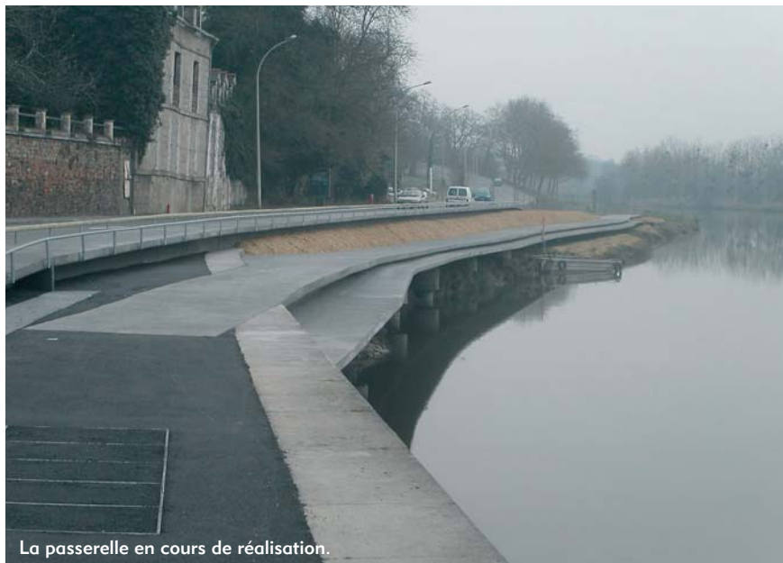
La passerelle en cours de réalisation.