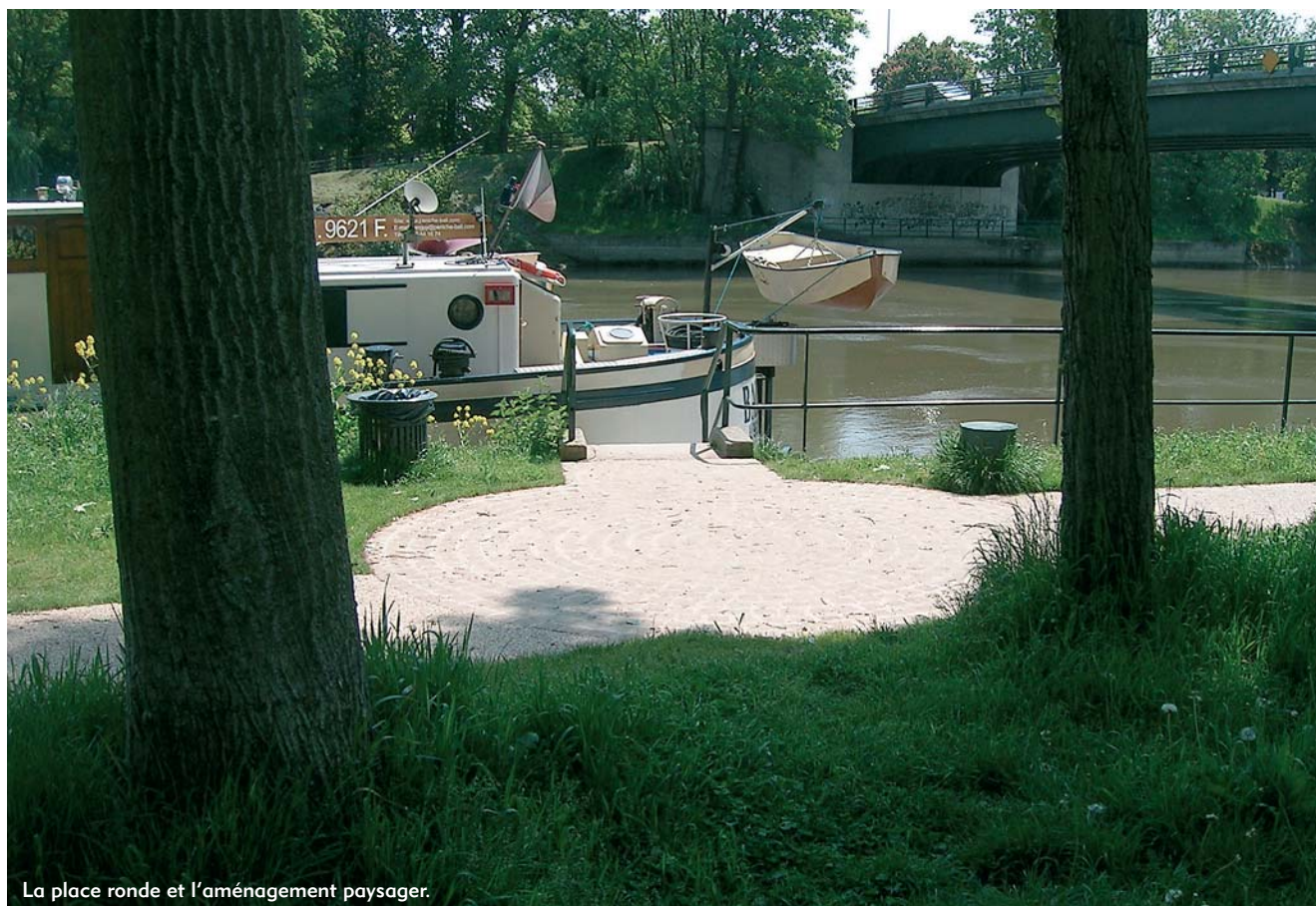
La place ronde et l'aménagement paysager.