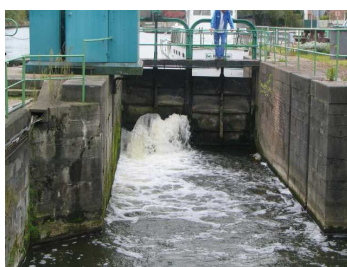
Fort de Scarpe- Barrage rive gauche

Des travaux d'harmonisation du système de transmission d'alarmes sur les barrages de Vitry-en-Artois, Lambres-lez-Douai, les Augustins à Douai, Fort de Scarpe, Lallaing, Marchiennes, et Warlaing ont commencé au mois de juillet et seront terminés fin novembre. Ces aménagements permettront d'interroger à distance un automate qui permettra de réaliser dans un proche avenir une gestion centralisée à distance des côtes d'eau.