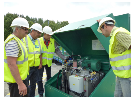
Écluse Folien à Valenciennes

Il s'agit également de préparer les ouvrages à une future conduite à distance, tout en prenant en compte les améliorations résultant des retours d'expérience sur les travaux passés.