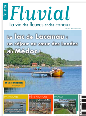
En couverture : Le lac de Lacanau et sa plage du Moutchic. (photo Olivier Chauvin)