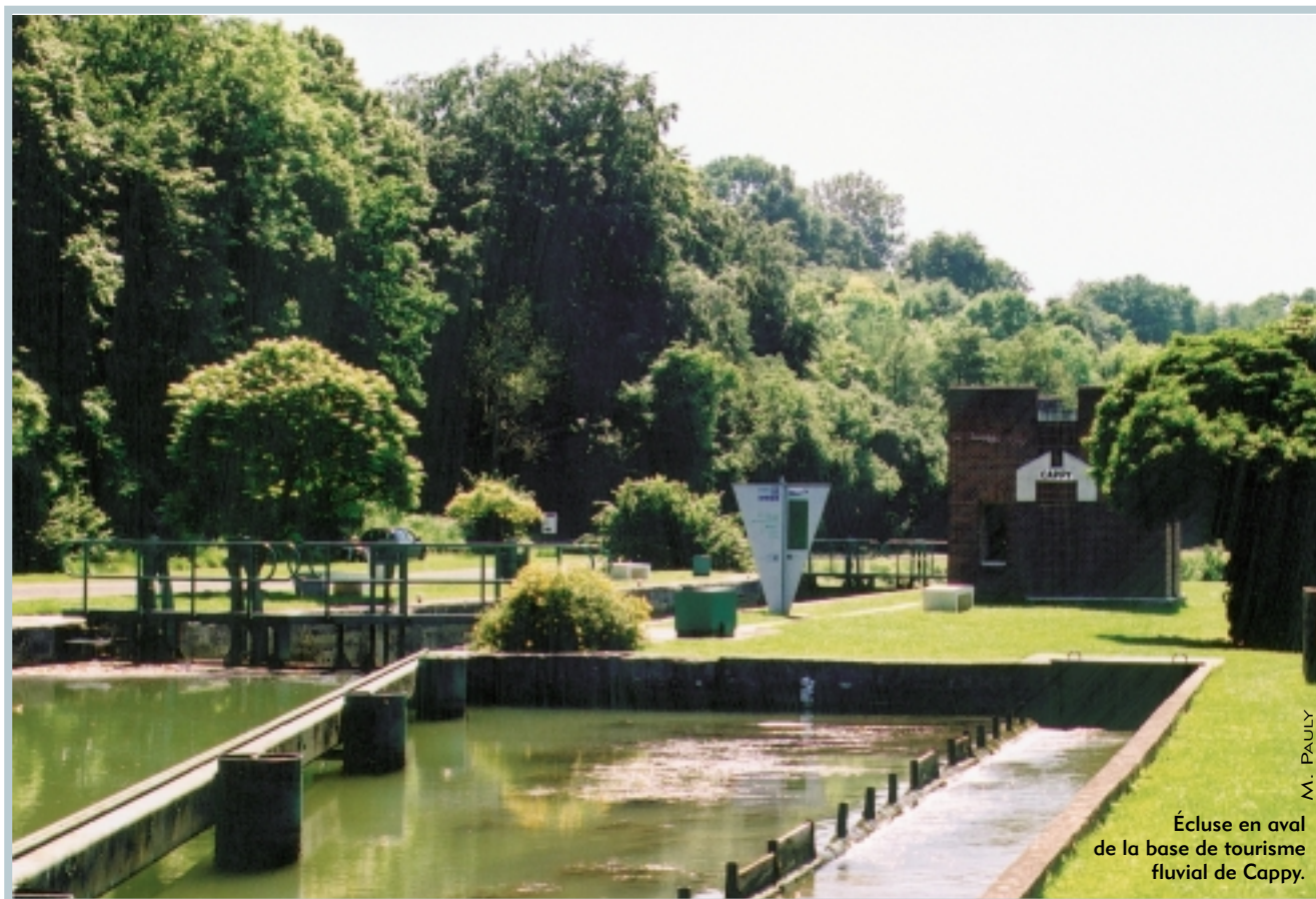
Écluse en aval de la base de tourisme fluvial de Cappy.

au cours de l'année 2001, le département de la Somme n'en poursuit pas moins son action dans ce domaine. Pour le plaisancier, le canal de la Somme évoque avant tout des images très agréables : vertes vallées et paysages sauvages ; succession d'étangs en bordure de canal ; fameux hortillonnages, véritables jardins flottants, à l'approche d'Amiens ou encore, en fin de parcours fluvial, l'arrivée enchantée en baie de Somme. Rappelons que ce canal, dans sa partie aval, est situé hors du réseau de Voies Navigables de France. Son aménagement et son exploitation, de l'aval de l'écluse N° 7 de Sormont à l'aval de l'écluse N° 25 de Saint-Valéry-sur-Somme, sont concédés au département de la Somme depuis 1992. Il est relié à l'important réseau navigable de la région Nord – Pas-de-Calais par le canal du Nord. Il est aussi rattaché au bassin de navigation de la Seine par ce même canal du Nord qui permet de rejoindre l'Oise. Dès 1990, le Conseil général de la Somme avait engagé un important programme protéiforme de près de 100 MF (15 244 900 € environ) dont l'objectif était la restauration des infrastructures du canal pour en améliorer sa navigabilité. Un certain