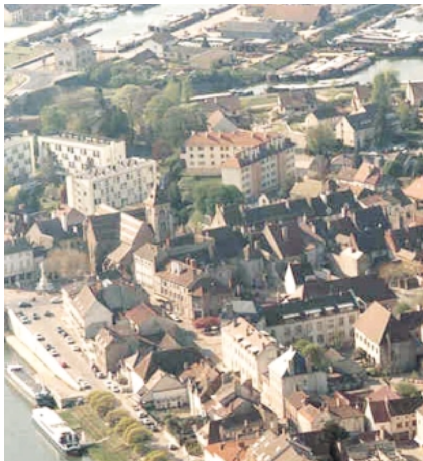
VILLE DE SAINT-JEAN-DE-LOSNE

P.L. : En effet, de 1843 à 1880, il s'appelait Quai Napoléon. Il avait été baptisé ainsi en raison de la légion d'honneur décernée à la ville par Napoléon en 1815 pour la féliciter d'avoir résisté aux armées autrichiennes. En 1880, on était alors sous la III e république, un conseiller municipal suggéra qu'on donne aux quais un nom un peu plus républicain et c'est ainsi qu'il fut appelé Quai National... ■