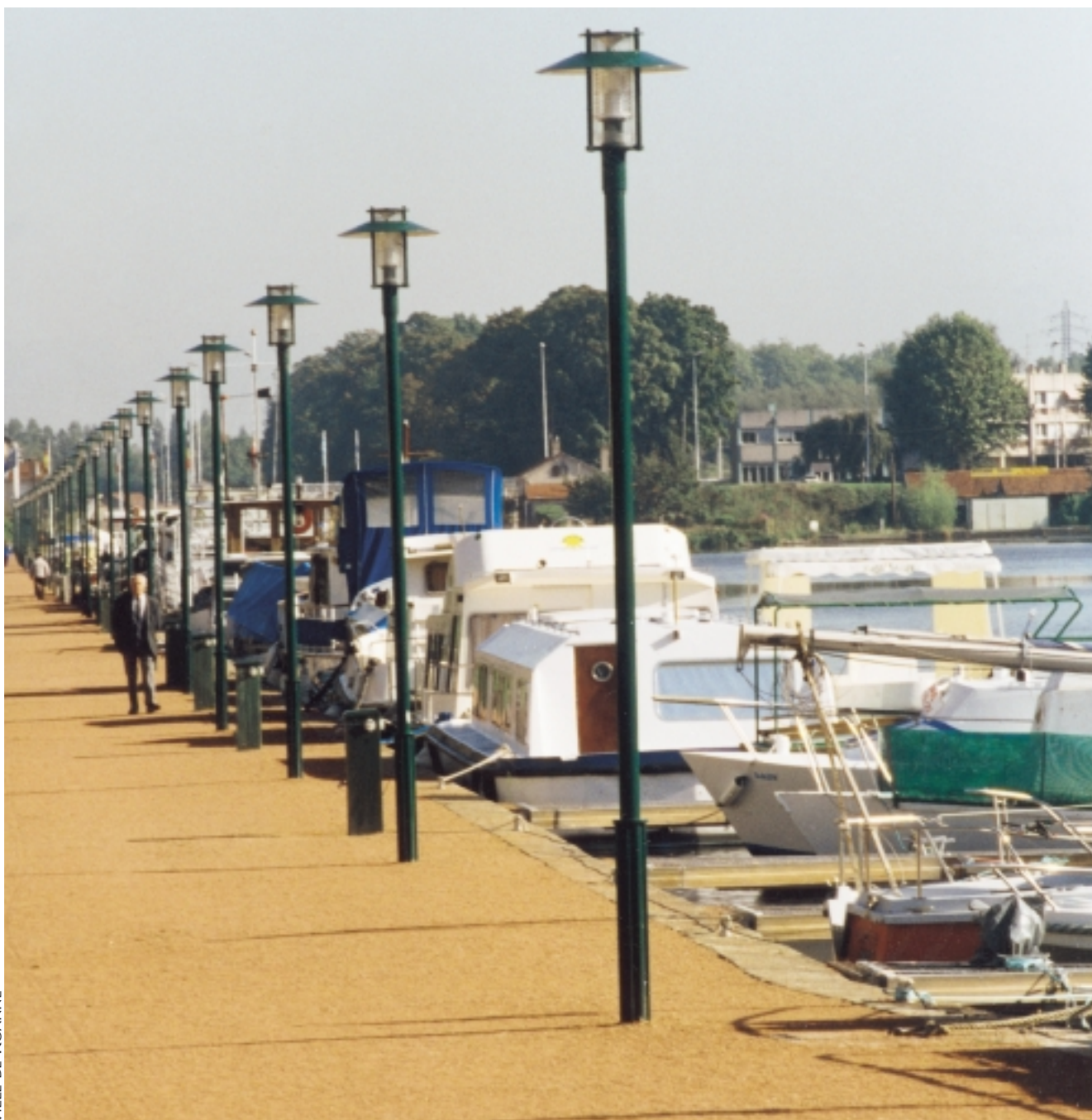
VILLE DE ROANNE

Un bel alignement de bateaux de plaisance le long du quai rénové de Roanne.