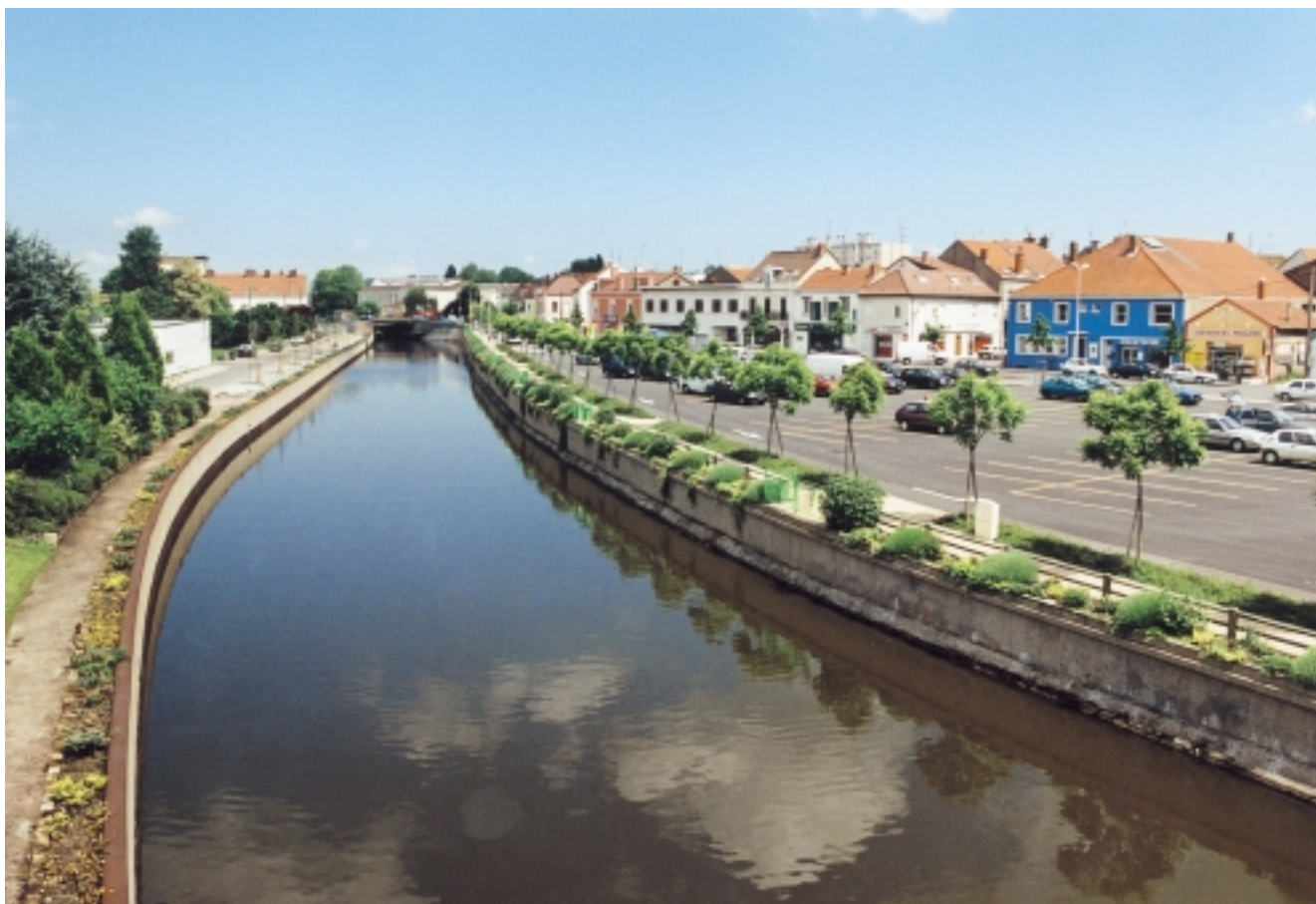
Les nouveaux abords du canal du Centre à Montceau-les-Mines, un exemple d'intégration réussie dans le paysage urbain !