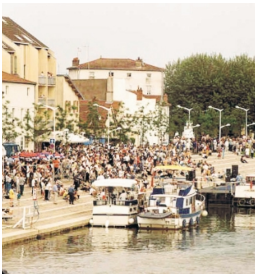
VILLE DE SAINT-JEAN-DE-LOSNE